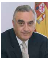
MARCOS PEÑA PINTO

Presidente del Consejo Económico y Social