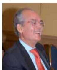
IGNACIO BUQUERAS Y BACH

Presidente del Consejo Económico y Social