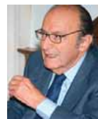
ENRIQUE FUENTES QUINTANA

Director de la oficina de la OIT en España