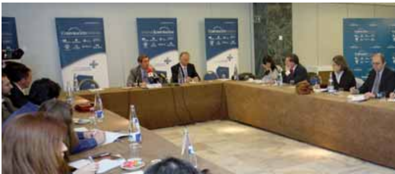
19 febrero 2008, Madrid. Presentación de Corporación Mutua a los medios de comunicación.