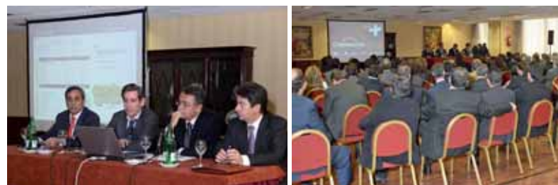
16 enero 2008, Madrid. Reunión de trabajo