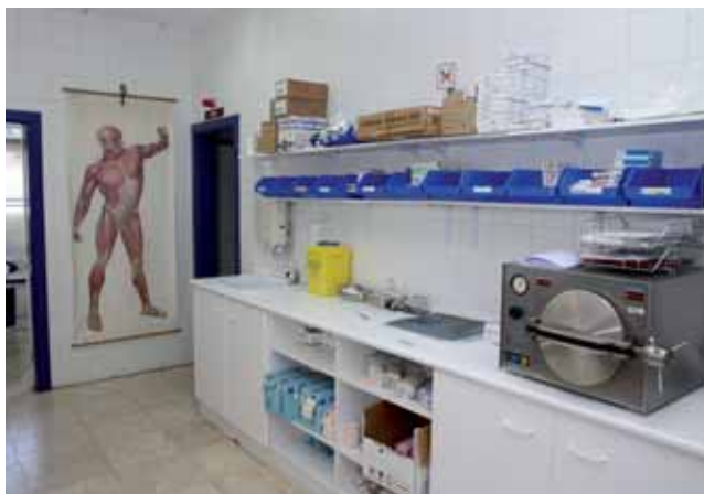
* Consulta Médica