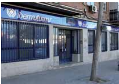
* Exteriores Centro C/ San Jaime