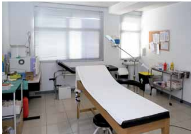
* Consulta Médica