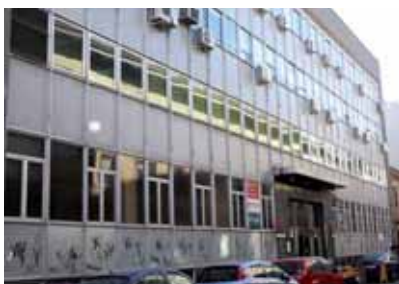
* Exteriores Centro C/ Aravaca