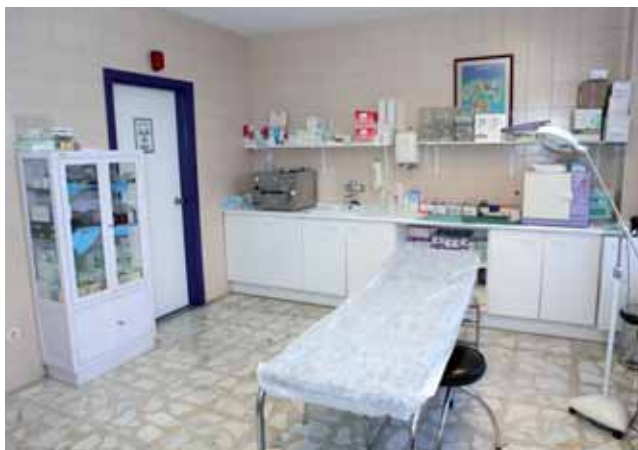
* Consulta Médica