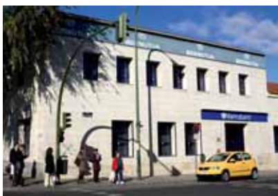
* Exteriores Centro C/ Emilio Muñoz