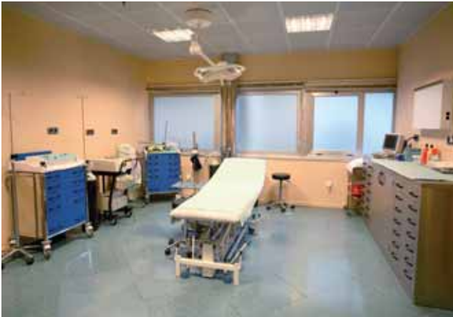
* Consulta Médica