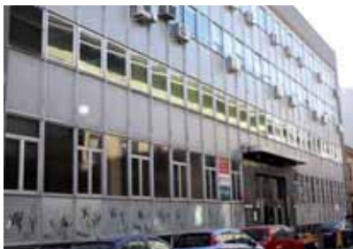
* Exteriores Centro C/ Aravaca