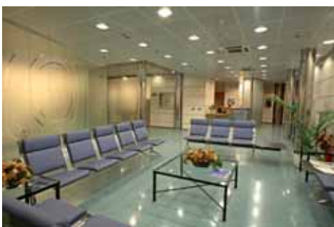
* Sala de espera