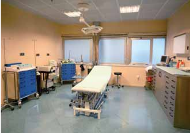
* Consulta Médica